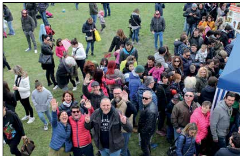
Grande interesse davanti ai gazebo-laboratorio per costruire aquiloni.