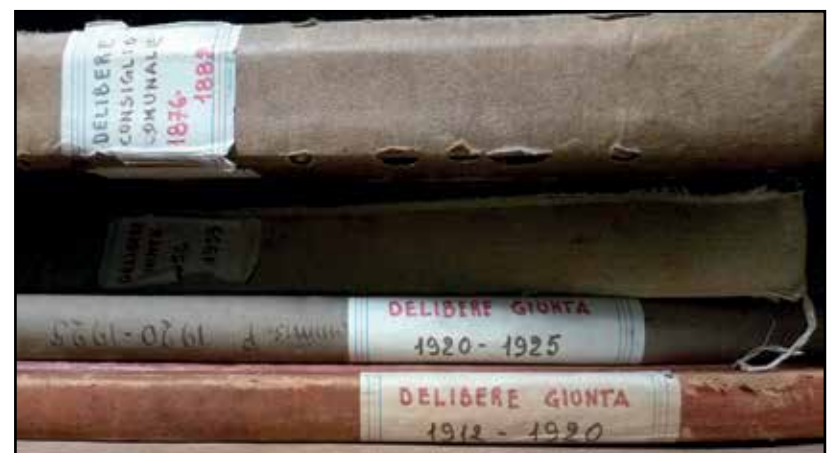
Le prime delibere della giunta del Comune di Montichiari.