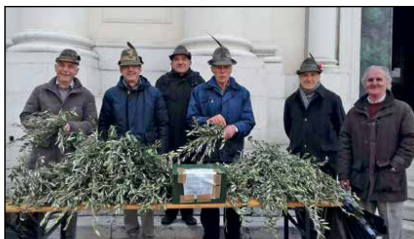
Alpini volontari in una delle diverse postazioni davanti alle chiese.

Il ricavato delle offerte viene donato alla parrocchia quale segno di un rapporto secolare degli Alpini con la Chiesa.