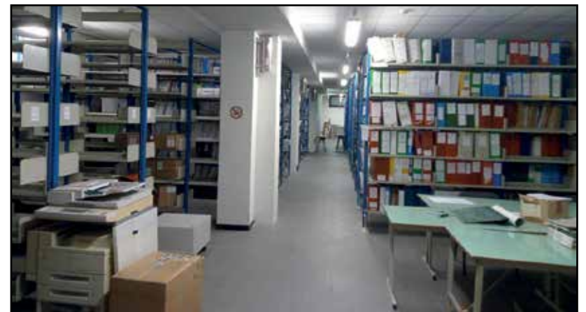
L'archivio dell'Amministrazione Comunale di Montichiari.

mazione utile non solo alle necessità degli uffici comunali, ma anche dei tanti ricercatori che