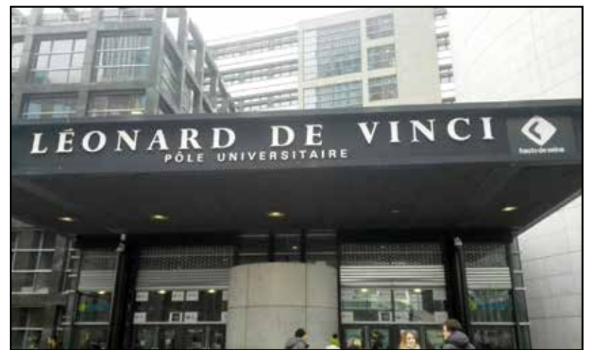
La sede dell'università di Nanterre.