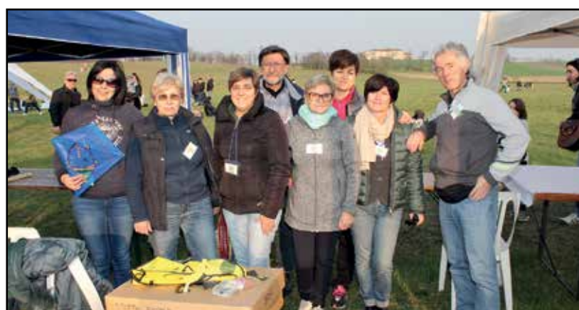
Alcuni degli organizzatori dell'evento.

Nella vasta area vi è un pista di atterraggio per piccoli aerei che hanno fatto diversi decolli