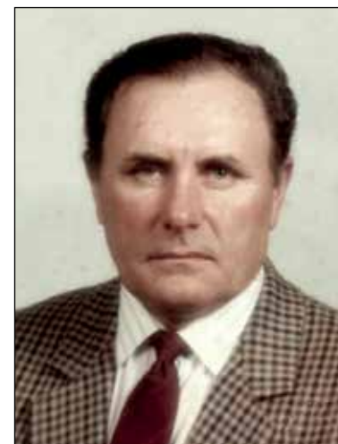
Giovanni Bellini 2° anniversario