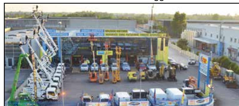
La nuova sede della Noleggio Lorini in zona industriale, via E. Montale 15.

SEDE: MONTICHIARI (BS) - Via E. Montale, 15 FILIALI: CALCINATO - CASTEGNATO tel. 030.9650556 - www.noleggiolorini.com